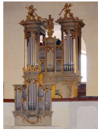
Szent István, Szent Imre