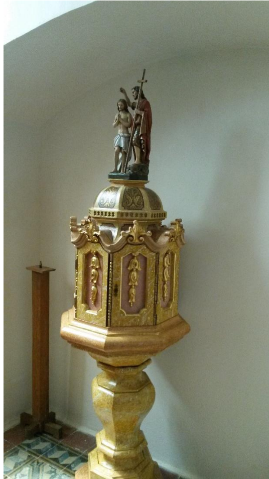
A nyolcszögletű faragott keresztelő-medence

Az oltár szobrai a Szűzanya szüleit, Szent Annát és Szent Joachimot ábrázolják. A Szűzanya fatimai szobra felett, két angyal szobra között egy Szent Józsefet ábrázoló kép látható. A kápolnában található még egy nyolcszögletű faragott keresztelő-medence – melyet Keresztelő Szent János és Jézus szobrai díszítik –, valamint a fogadalmi ajándékok rokkó vitrinje.