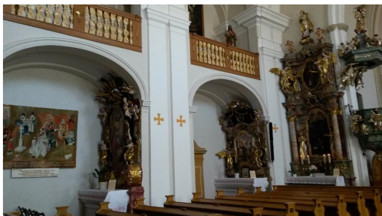
A templomhajó északi oldala

A templomhajó bal, északi oldalán (evangéliumi oldal) a Remete Szent Pál mellékoltáron kívül még két mellékoltár áll: középen a Kapisztrán Szent János oltár, míg a bejárathoz közelebb a Szent Hedvig oltár.