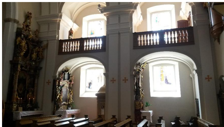
A templomhajó déli oldala

A templomhajó jobb, déli oldalán (leckeoldal) Az Irgalmas Jézus Öt Szent Sebe mellékoltáron kívül – a bal oldalhoz hasonlóan – ugyancsak két mellékoltár áll még: középen a Szent András oltár, míg a bejárathoz közelebb a Boldog Özséb oltár.