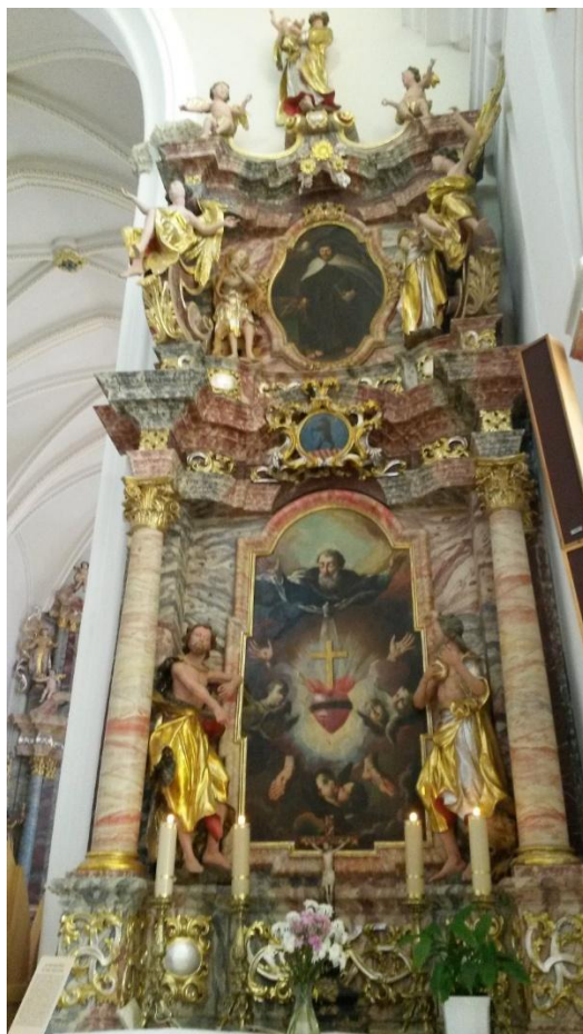
Az Irgalmas Jézus Öt Szent Sebe oltár

A képtől balra Keresztelő Szent János, jobbra Szent Jeromos szobra látható az általa meggyógyított oroszlánnal. A második szint központi alakja Remete Szent Antal, az őt ábrázoló képet balról Egyiptomi Szent Mária, jobbról pedig Szent Paula szobra keretezi. A retabló oromzatán az oltárt a gyermek Jézust tartó Szent József szobra zárja.