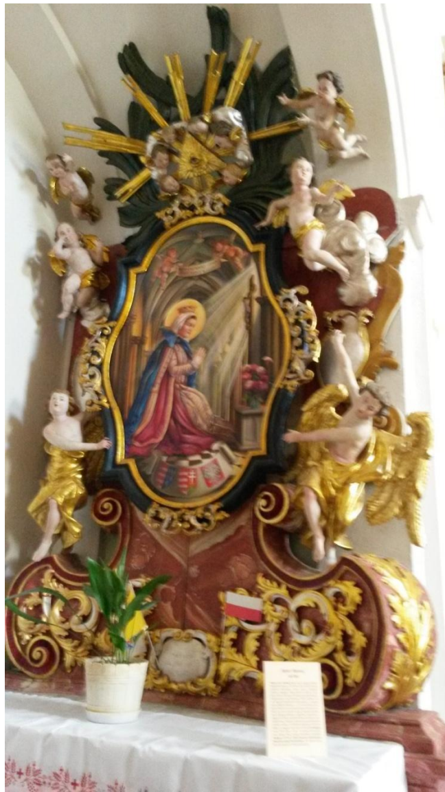
Szent Hedvig oltár