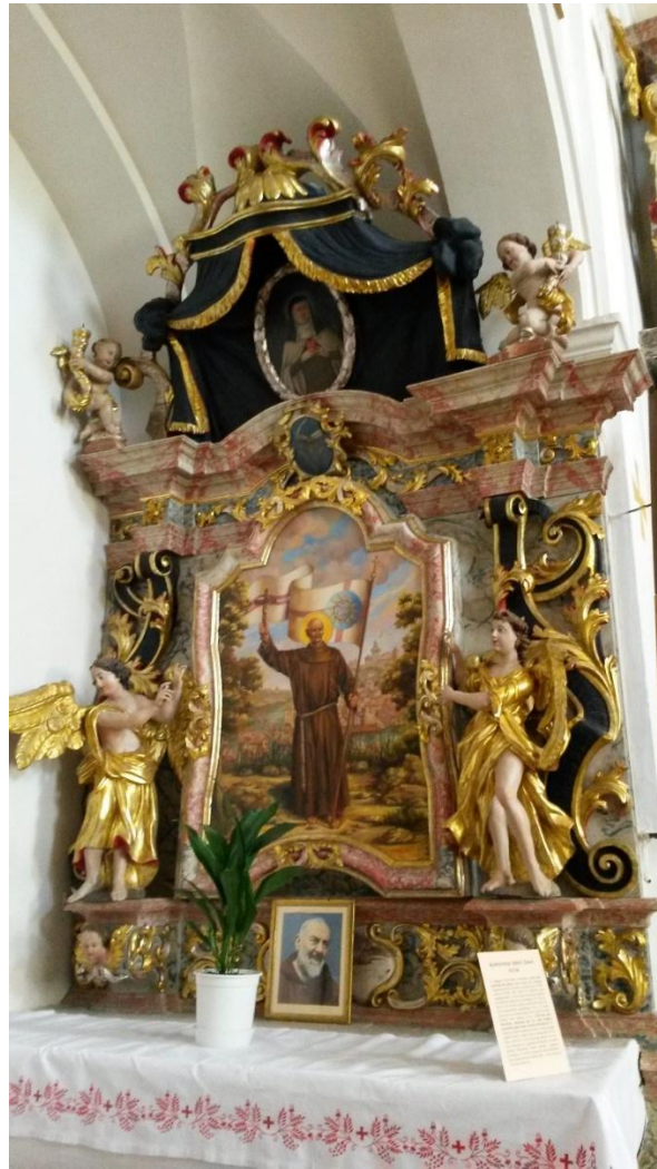
Kapisztrán Szent János oltár

Kapisztrán Szent János – aki a nándorfehérvári győzelem kivívásában kulcsszerepet játszott – 1455-ben Nosztrán járt, ahonnan így írt: „Aki testben szenteket akar látni, menjen Nosztrára!”