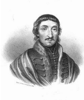
Csokonai Vitéz Mihály