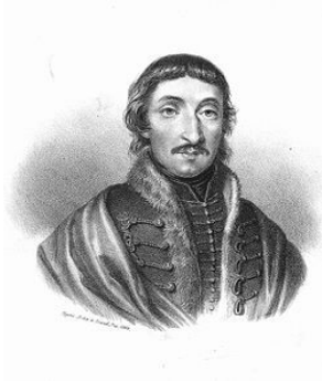
Csokonai Vitéz Mihály